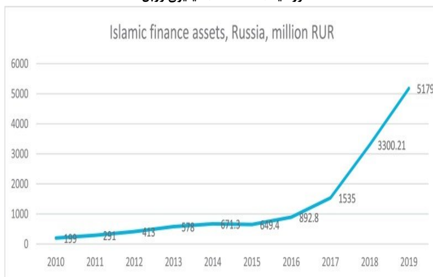
نمودار شماره (۲): رشد دارایی‌های تامین مالی اسلامی در روسیه (۲۰۱۰-۲۰۱۹) میلیون روبل