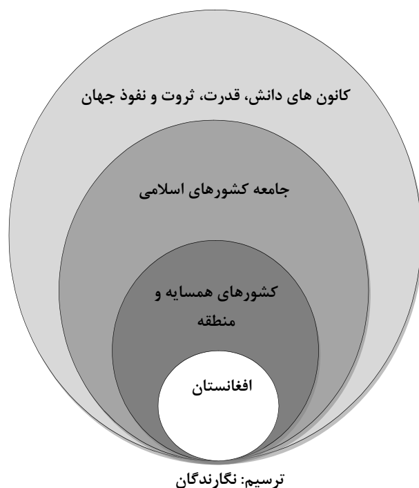
شکل شماره ۳: حلقه های سه گانه سیاست خارجی افغانستان

سومین پویایی تغییر رویکرد سیاست خارجی افغانستان از توازن گرایی به تعادل گرایی است. افغانستان در حکومت وحدت ملی از توازن گرایی به تعادل گرایی روی آورده است. تا سال ۱۳۹۴ سیاست خارجی این کشور مبتنی بر توازن بوده است، اما در دوره جدید سیاست تعادل مورد توجه قرار گرفته است. در این سیاست همه کشورها به اندازه وزن شان در سیاست خارجی افغانستان اهمیت می یابند (تمنا، ۱۳۹۵).