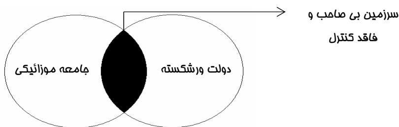
شکل شماره ۲: دولت ورشکسته و جوامع موزاییکی

امروزه افغانستان دارای یک دولت ضعیف بوده که فاقد اقتدار مرکزی و کنترل بر تمامیت ارضی و سرزمینی کشور است. به عنوان نمونه بر اساس گزارش‌های موجود، دولت افغانستان در حال حاضر (۲۰۱۷) توان اعمال حاکمیت بر نزدیک به نیمی از سرزمین خود را ندارد (Almukhtar, 2017). بنابراین افغانستان به عنوان یک دولت ضعیف - ملت ضعیف شناخته می‌شود. یافته‌ها حکایت از آن دارند که کشورهایی که در آن‌ها دولت شکننده و ضعیف حاکم و جامعه آن از موزاییک قومی در رنج است، به سوی منازعات مسلحانه قومی پیش می‌روند (هادیان، ۱۳۹۳: ۱۴۵).