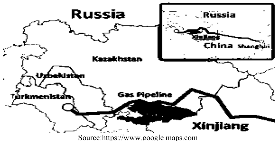
شکل شماره ۲: مسیر خط لوله چین - ترکمنستان

در ساخت خط لوله آسیای مرکزی چین از چهار خطلوله A, B, C, D استفاده شده است. خطوط لوله A و B در سال ۲۰۰۹ و ۲۰۱۰ به اجرا درآمدند. خطلوله C نیز در سال ۲۰۱۳ تکمیل و در ۲۰۱۴ به مرحله بهره‌برداری رسید. سه خطلوله اول خطوط موازی هستند و یک مسیر را طی می‌کنند که از سامان تپه در ترکمنستان آغاز و به مرز خرگاس ۱ در چین می‌رسد. ظرفیت انتقال گاز طبیعی طراحی شده برای این سه مسیر ۲۵ میلیارد مترمکعب در سال است که از این میزان ده میلیارد مترمکعب سهم ترکمنستان، ده میلیارد مترمکعب سهم ازبکستان و پنج میلیارد مترمکعب نیز برای قزاقستان در نظر گرفته شده است (Wang, 2016:3). خطلوله D مسیر دیگری را از طریق ازبکستان، تاجیکستان و قرقیزستان طی می‌کند، متفاوت بودن مسیر D به این علت است که چینی‌ها بتوانند از طریق آن گاز تاجیکستان را نیز انتقال دهند (Azernews, 2017) زیرا در زمان ساخت آن شرکت ملی نفت چین مذاکرات خود را با تاجیکستان نیز جهت قراردادهای اکتشاف و تولید آغاز کرده بود، ساخت این خطلوله در دسامبر ۲۰۱۴ آغاز شد و هنوز به مرحله بهره‌برداری نرسیده است.