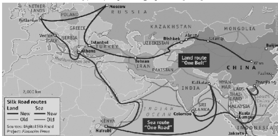
شکل شماره ۱: مسیرهای جاده ابریشم قدیم و جدید

تجن-سرخس-مشهد ۱ اشاره کرد که در می ۱۹۹۶ افتتاح شد و کشورهای محصور در خشکی آسیای مرکزی را از طریق ایران و با کوتاه‌ترین راه متصور به ترکیه، خاورمیانه و شرق دور پیوند می‌دهد. مفهوم جاده ابریشم جدید چین به طور کلی با رویکردهای حمل و نقل و ارتباطات ترکمنستان سازگار است و با توجه به سیاست‌های اتخاذ شده توسط مقامات ترکمنی در زمینه همکاری‌های بین‌المللی جهت توسعه خطوط حمل و نقل این کشور می‌تواند سهم قابل توجهی در احیای مسیر جاده ابریشم داشته باشد (Rustamova, 2016) به گفته شی جین‌پینگ ۲ ، رئیس‌جمهور چین دو کشور همکاری‌های خود را در این بخش توسعه خواهند داد و ضمن قدردانی از حمایت و مشارکت ترکمنستان در ابتکار "یک کمربند، یک راه" اعلام کرد آماده تقویت همکاری‌های دوجانبه با عشق‌آباد است (Chinadaily, 2017).