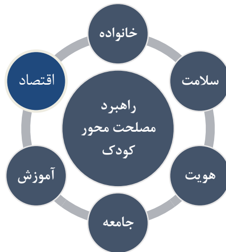
نمودار ۲. شکل‌گیری روابط جدید کودکان بازگشته از داعش

قرار گرفتن بازیگران در شبکه معنایی و مادی موجب ظهور موجودیت جدیدی در قالب جعبه سیاه می‌شود و روابط و مناقشاتی را که برای ایجاد آن لازم بود پنهان می‌کند (Bueger & Gadinger, 2018: 83). در این شبکه معنایی جدید، حول راهبردی مبتنی بر مصلحت کودک، روابط جدیدی براساس مناسبات خانواده، آموزش، اقتصاد، سلامت، هویت بدون برچسب‌های تحقیرآمیز و با حمایت دولت و جامعه شکل می‌گیرد.